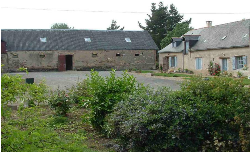
L'étable où est née Maman